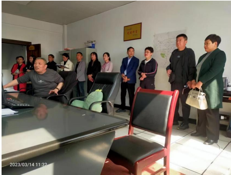
（图为：清源水业公司集体观摩学习）

自身工作实际情况，学会找差距、找短板、定目标、定措施；大家要坚持定了干，干必成、成必优的工作原则；在以后的工作中，一定要抓细节、抓提升、抓推进落实，拿出更多务实有效的举措，着力提升供水管理水平和服务质量，守牢安全供水生产这道防线。