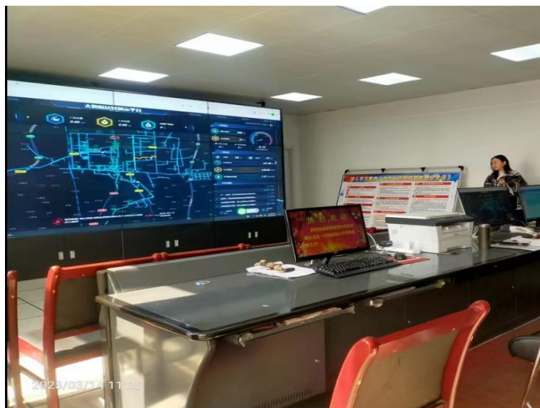
（图为：确山县水务公司智慧水务平台）

大家通过“看、问、记、思”等方式零距离感受到确山县水务公司智慧水务的自动化运行和信息化调度的先进做法。在对比中，体验到我们自己的差距和不足；在记录中，感受到我们要学习的新内容、新模式；在思考中，激发了我们比、学、赶、争上游的信心和力量。