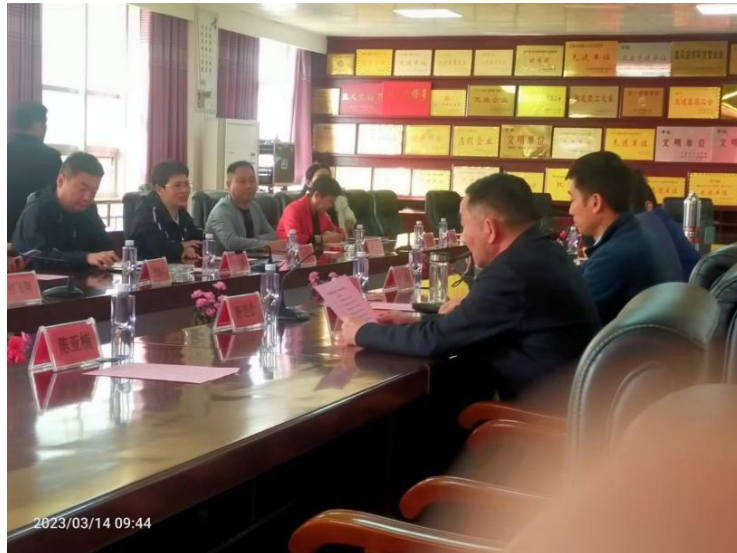
（图为：召开座谈会议）

大家通过“看、问、记、思”等方式零距离感受到确山县水务公司智慧水务的自动化运行和信息化调度的先进做法。在对比中，体验到我们自己的差距和不足；在记录中，感受到我们要学习的新内容、新模式；在思考中，激发了我们比、学、赶、争上游的信心和力量。